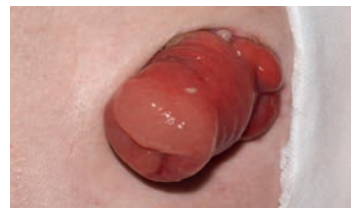
Stoma direkt nach OP